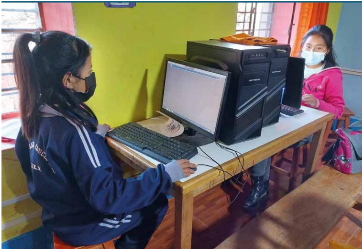
Kinderen in Coronatijd zoveel mogelijk in het onderwijs houden

2022 is al met al een bijzonder jaar voor HoPe geweest met, naast het opstarten van oude programma's, aandacht voor de verdere ontwikkeling van nieuwe programma's en de uitwerking van ideeën die tijdens de crisis zijn ontstaan. HoPe heeft ook dit jaar bewezen een veerkrachtige en innovatieve stichting te zijn die samen met de inheemse bevolking werkt aan een beter leven en aan grotere kansen voor de kinderen op een mooie toekomst.